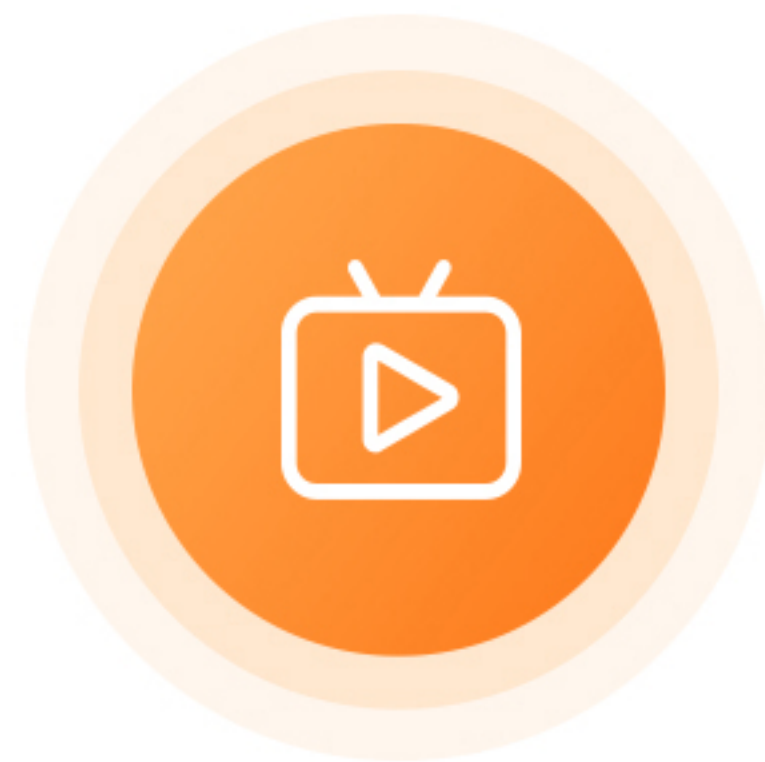
短视频、直播平台推广