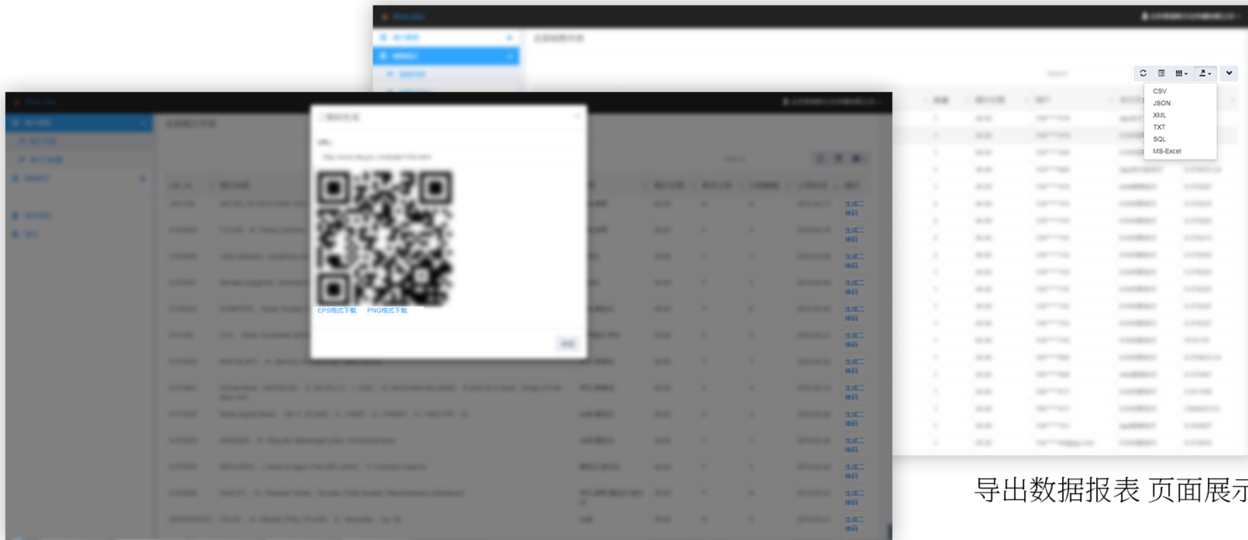
导出数据报表 页面展示